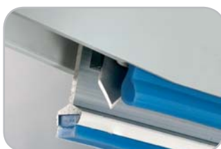
Taglierina su modello S 400/2T Cutter on model S 400/2T