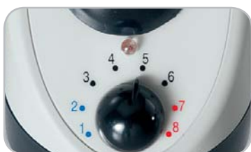
Timer tempo sigillatura Timer for sealing time

Fast and easy-to-use sealers are indispensable devices for food management. These can seal all types of plastic bags for food, with thicknesses of up to 2mm and across a length of 300 or 400mm. The timer fitted at the front is used to seal bags of different thicknesses, while model S400/2T, fitted with a cutter, eliminates the remaining parts of the bags. Sealable materials: PE, PP, LDPE, PVC.